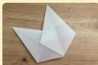
Stern zusammenkleben; Bild: Internet-ABC

Drehe die Zacken um, sodass die gefaltete Seite nach unten zeigt. Verteile Klebstoff an einer Seite der breiten Spitze.