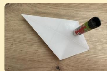
Klebstoff auftragen; Bild: Internet-ABC

Falte die andere Seite genauso zur Mitte. Wiederhole die Schritte 1 bis 5 nun so oft, bis du 8 solcher Zacken erhältst.