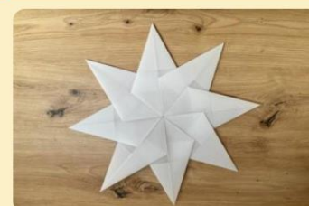
Winterstern fürs Fenster

Klebe nun alle Zacken zusammen. Achte darauf, dass die Spitze immer genau auf der Spitze anderen Zackens liegt.