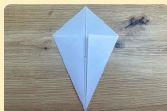
Einzelteil Winterstern

Nimm nun eine Ecke und falte sie so, dass die Kante und die Mittelfalte eine Linie bilden.