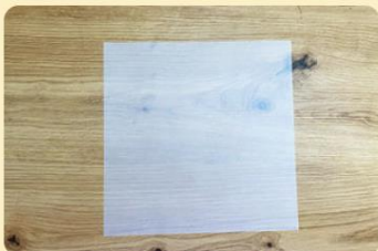
Transparentpapier zum Falten; Bild: Internet-ABC

Tipp: Du kannst auch buntes Papier nehmen, oder die einzelnen Teile der Sterne aus verschiedenen Farben zusammensetzen.