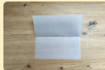
Transparentpapier 1x gefaltet; Bild: Internet-ABC

Lege ein Stück Transparent-Papier bereit.