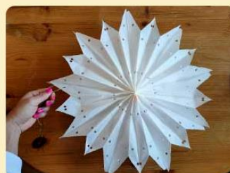
Fertiger Winterstern

6. Nimm nun die oberste und unterste Tütenspitze in die Finger und lege die Spitzen aufeinander. Dadurch klappen sich die Tüten auf und es entsteht ein schöner Stern. Klebe die oberste und unterste Tüte wie in Schritt 3 zusammen.