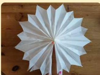
Aufgeklappter Winterstern; Bild: Internet-ABC

5. Wenn du möchtest, kannst du die Tüten mit einem Locher bearbeiten. Durch die Löcher fällt später das Licht, was ein schönes Muster ergibt.