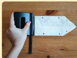
Gelochte Butterbrot-Tüten

4. Mit einer Schere kannst du nun Zacken in den oberen Rand schneiden, wo sich die Öffnungen befinden.