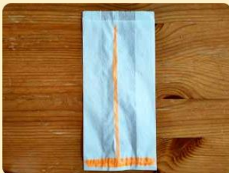
Butterbrot-Tüte mit Markierung

1. Nimm dir eine Butterbrot-Tüte und lege sie vor dich. Die Öffnung der Tüte sollte von dir weg zeigen.