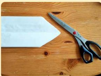
Angeschnittene Butterbrot-Tüten; Bild: Internet-ABC

3. Lege eine zweite Tüte auf die Klebefläche. Dabei muss die Öffnung der Tüte immer nach oben zeigen. Wiederhole diesen Schritt, bis du alle Tüten zusammengeklebt hast.