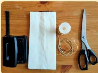
Material für einen Winterstern; Bild: Internet-ABC